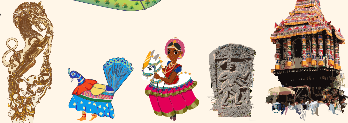
மேலதிக பாரம்பரிய நினைவுச்சின்னங்களைப் பற்றி அறிய எமது இணைய தளத்திற்கு வருவோமாகிறோம். www.intachmadurai.org