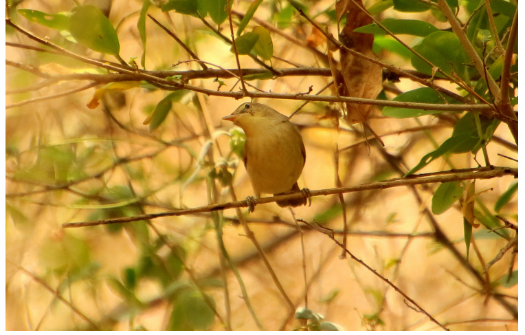
பெரிய அலகு கதிர்க்குருவி