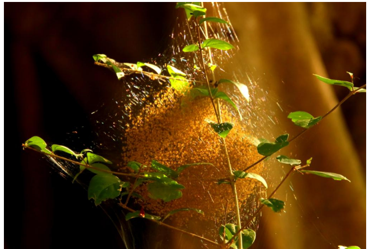
சுருள் கோளவலைச் சிலந்தி