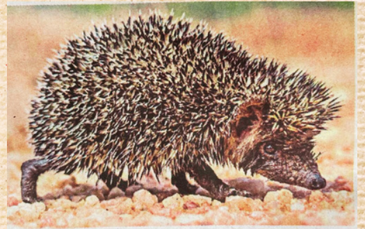
மதுரை இடையபட்டி கோயில் காட்டில் உள்ள தென்னிந்திய முள்ளெலி

தெரிக்காடுகள், புதர்கள், வறண்ட நிலப்பகுதிகள், மேலும் உயரமர்ன மலைப்பகுதிகள் போன்றவற்றில் வாழுகிறது. பூச்சிகளை இவை அதிகமாக உட்கொள்வதால் சங்கிலியின் தொடர்புக்கு உறுதுணையாக இருக்கிறது. இந்தியாவின் தென்மாநிலங்களுள் ஒன்றான தமிழ் நாட்டில் மட்டும் தற்பொழுது காணப்படுகிறது.